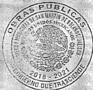
SELLO DE LA OFICINA

NOTA: FAVOR DE LLENAR EL CERTIFICADO UNA VEZ CONCLUIDA LA COMISIÓN Y ANOTAR ESTRICTAMENTE LOS DÍAS DE ESTANCIA DE CADA UNA DE LAS PERSONAS COMISIONADAS.