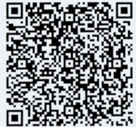
Elaborado con ARGOM en argomx

Este documento es una representación impresa de un CFDI.